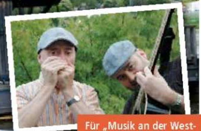
Für „Musik an der Westfälischen Mühlenstraße“ sorgt das Duo „A20“.